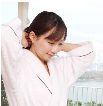
首の疲れをとり集中力を高めるセルフ指圧

バイタルポイントをどのように指圧するかは指圧師が患者の状態に合わせて判断するとご説明しました。訓練を受けた指圧師は手指が非常に敏感で、一押し一押しで皮膚や筋肉の異常などを感じとり、患者の身体の状態を正確に診断します。その状態に合わせて治療していくことを「診断即治療」といい、他の医療行為と違う指圧の特徴です。