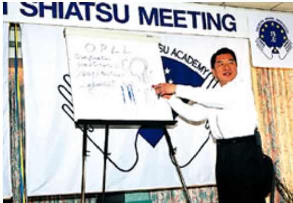
海外で講演する浪越徹

3. 二代目であるお父様の浪越徹さんが、指圧を世界の“SHIATSU”に発展させたと言われていますが、どのようなことをなさったのでしょうか？