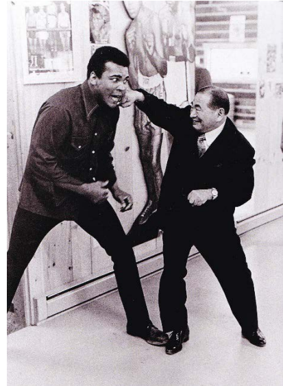
モハメッド・アリにパンチ！ 徳治郎は冗談が大好きだった。

祖父は吉田茂元総理をはじめとする歴代総理大臣や、新婚旅行で来日したマリリン・モンローに指圧をしたことで有名です。祖父が治療した多くの著名人の中には、ボクシングヘビー級のチャンピオンだったモハメッド・アリもいます。私はアリと祖父が記念に撮った写真が好きでいつも持ち歩いています。アリと祖父の明るく楽しい性格が良く出ている写真です。