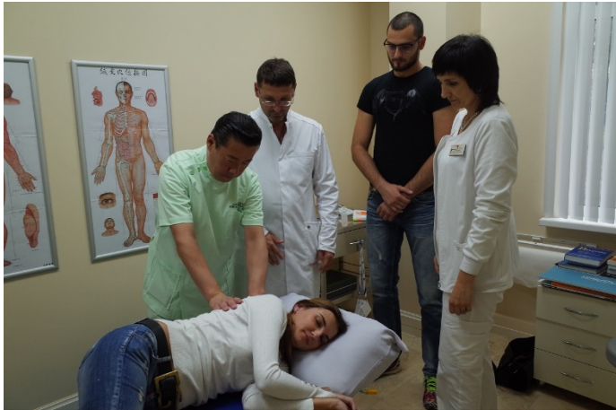
ベラルーシスポーツリハビリセンターにて指圧治療

指圧をすることによって、皮膚機能が活性化され、筋肉組織が柔軟化され、体液の循環が促され、神経機能の調和がはかられ、内分泌が調整され、骨格のバランスが整えられ、消化器系が正常化されます。これら7つの効果が指圧療法の効用の最も重要な要素です。