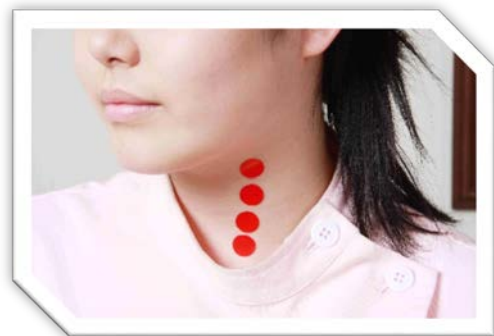
頸動脈沿いのバイタルポイント

ことにより、人間に本来備わっている自然治癒力の働きが促進され、健康を増進させます。