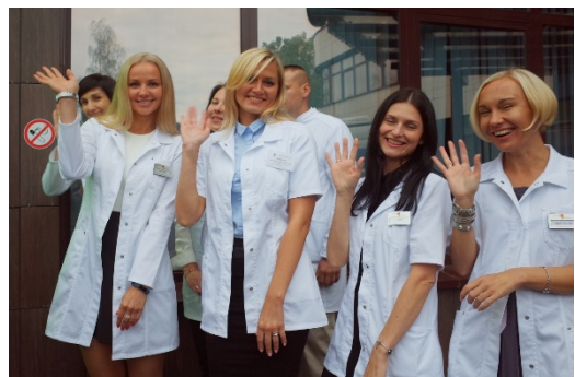
指圧講習に参加したリハビリセンターのスポーツドクター

暑い、寒いなど環境の変化により、健康な人でも体調は常に変り変調を起こします。指圧は体調を整えるコンディショニング効果があります。美容の面でも顔色が悪い、足がむくむなどの変調に指圧は効果的です。